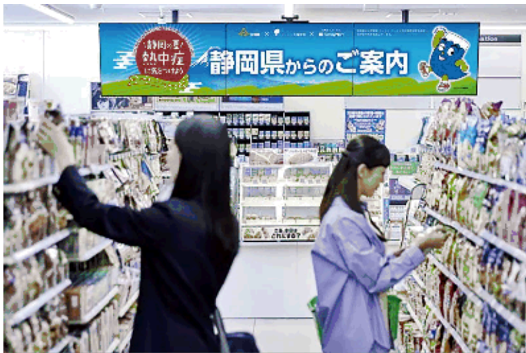
(店内サイネージ例)