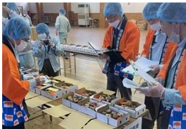
昨年度の品評会の様子