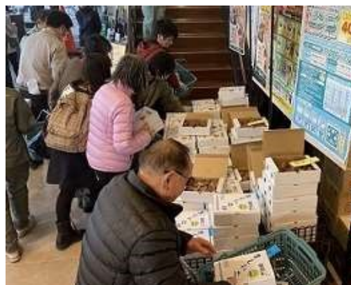
昨年度の即売会の様子